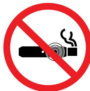
Otros productos de tabaco