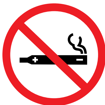
Dispositivos susceptibles de liberación de nicotina